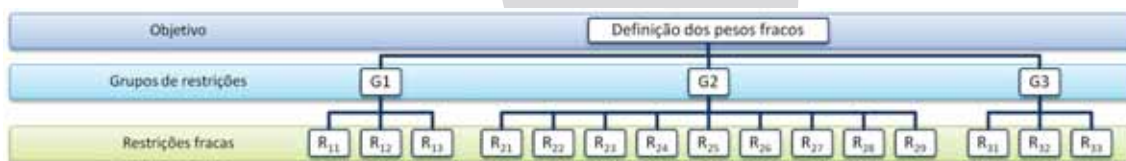
Figura 3 – Árvore hierárquica

A Figura 3 mostra a árvore hierárquica desenvolvida, utilizando as restrições fracas descritas na seção 3.1.