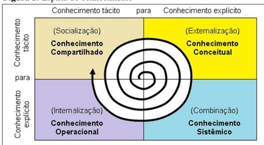
Figura 1: Espiral do conhecimento

A Gestão do Conhecimento é a essência principal desse trabalho e através dela todos os procedimentos foram apoiados. Foi utilizada a combinação como principal forma de conversão do conhecimento, visto que o ponto de partida se deu através de dados já explicitados, tais como, o conhecimento dos especialistas que foi externalizado por [Hoffmann 2016] entre outros. O fato de este trabalho ter como objetivo a identificação dos fatores que mais influenciam na evasão, também é uma forma de internalizar o conhecimento, visto que, através dele é possível sistematizar a busca deste conhecimento. Desta forma, o conhecimento sobre evasão segue o caminho da espiral do conhecimento (Figura 1) utilizando-se da combinação de conhecimentos distintos para geração de novos conhecimentos e da internalização para manter as informações disponíveis aos gestores.